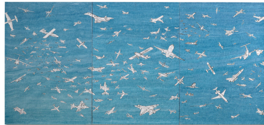
Alighiero Boetti Aerei 1983 biro su carta serigrafata (in tre parti) 98 x 208 cm